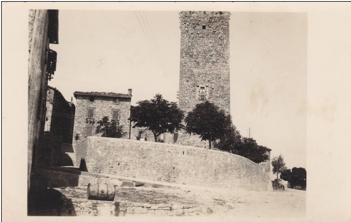
Figura 9 Foto fine anni '40 della Torre di Montegabbione vista da est in cui si nota in grande muro contenitivo ancora presente.