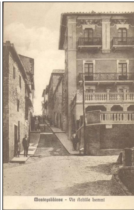
Figura 7 A sinistra cartolina anni '50 con vista sulla parte a nord della via Achille Lemmi, a destra cartolina anni '20 con vista sulla parte a sud della Via Achille Lemmi.