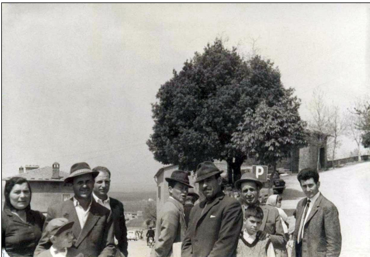
Figura 1: Foto anni '60 della Porta

Come ben si può intuire da questa breve descrizione, delle porte medioevali a Montegabbione non c'è traccia; non perché non siano mai esistite ma perché la volontà degli uomini, in tempo di pace, le ha distrutte. Ma andiamo per gradi.