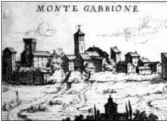
Figura 2 La stampa della veduta di Montegabbione del 1662