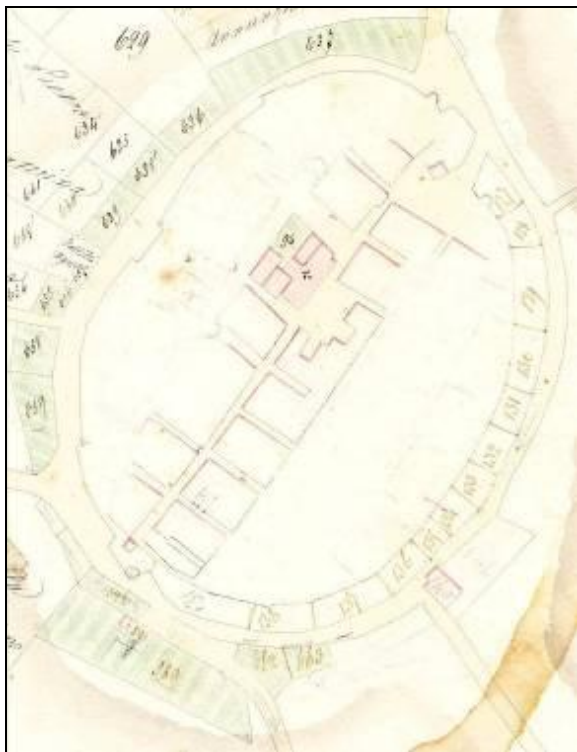
Figura 4 Pianta di Montegabbione - 1860 - Archivio Parrocchiale di Montegabbione

Un altro documento interessante per l'argomento trattato è rappresentato da una mappa catastale del 1860 conservato nell'Archivio Parrocchiale di Montegabbione. Nella mappa è ben visibile la porta di Ponente, quella dell'attuale "Porta" mentre non è presente la porta di levante, che fosse stata già abbattuta. Interessante è anche notare come la strada per uscire da Montegabbione verso nord passasse a destra della torre e non a sinistra come l'attuale.