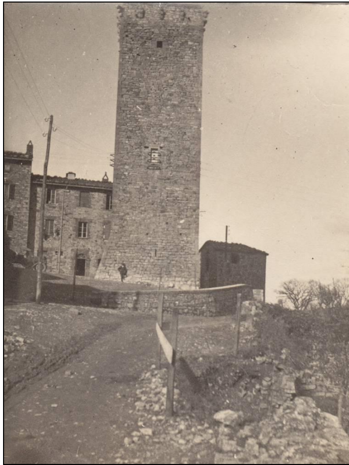
Figura 8 Foto anni '30 della Torre di Montegabbione vista da Est dove si nota un piccolo muro contenitivo probabilmente eretto durante i lavori di costruzione della via Dritta.