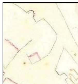
Figura 6 La torre e l'ingresso di levante al paese posizionato diversamente rispetto all'ingresso attuale.

Un'ipotesi verosimile sulla distruzione della porta di Ponente nasce dalla lettura di un documento conservato nell'Archivio Comunale di Montegabbione: nel manoscritto degli Istomenti 1790-1860 è presente la descrizione delle opere compiute dal sindaco Fabio Duranti tra le quali una inerente la costruzione di due vie all'interno del paese: