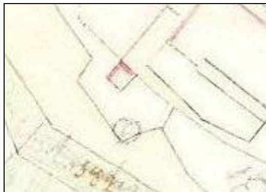
Figura 5 La vecchia porta di ponente ormai distrutta.