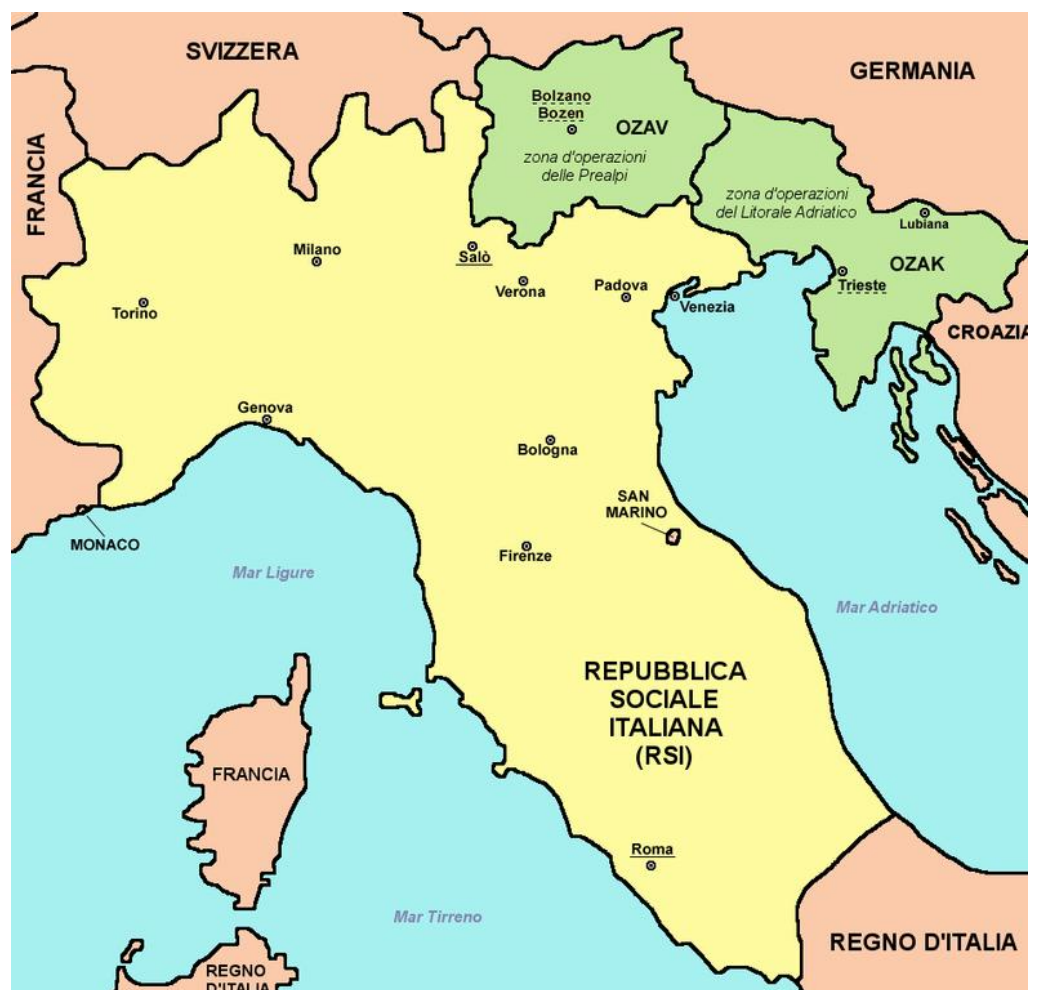
Figura 1. Repubblica Sociale Italiana, estensione geografica a settembre 1943