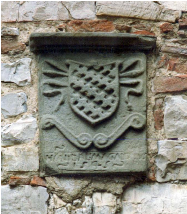
Figura 1 Stemma nel palazzo di fronte alla piazza

I Monaldeschi furono una nobile famiglia orvietana da sempre in conflitto per il predominio sulla città con la famiglia dei Filippeschi. Dante Alighieri li ricorda addirittura nella Divina Commedia: