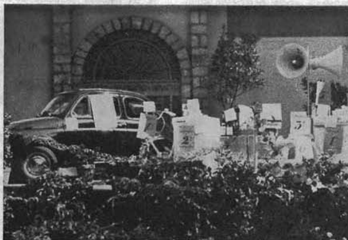
I ricchi premi della Grande Lotteria di Montegabbione organizzata dalla Pro Loco